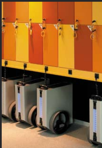
Bild linke Seite oben: Überall im geräumigen, offenen Verwaltungsgebäude finden Mitarbeiter Teeküchen, Sofa-Nischen und andere Treffpunkte. Bepflanzte Innenhöfe sorgen nicht nur für schöne Aussichten und natürliche Beleuchtung. Sie verhindern zudem, dass sich das Gebäude im Sommer zu stark aufheizt. Unten: Internet- und Telefonverbindungen über Funk, mobile Stromquellen und die offene Raumgestaltung ermöglichen den schnellen Umbau von Abteilungen und bequeme Formierungen von Arbeitsgruppen

E-Shuttles: Prototypen mobiler Lithium-Ionen-Akkus, die von der Solon-Ausgründung Younicos entwickelt werden, versorgen einen Mitarbeiter bis zu zwei Tage lang mit Strom. Damit diese auch am dritten Tag noch ungehindert arbeiten können, sollen die Ein-Kilowattstunden-Speicher jeden Abend an die »Tankstationen« unter den Spinden angeschlossen werden.